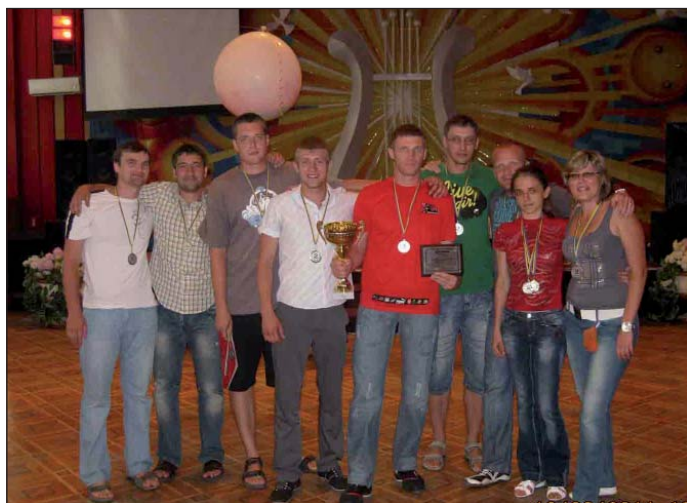
Відбулася молодіжна спартакіада Атомпрофспілки. (Інформація — на 2-й стор.)