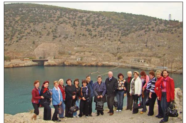
Бухгалтерский корпус Атомпрофсоюза на экскурсии в АР Крым