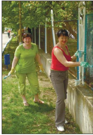
Шефская помощь центру социально-психологической реабилитации детей

ценный опыт. Конкурсы профессионального мастерства среди молодых атомщиков, которые проводятся в Украине с 2000 года, дают возможность выявить лучших работников. По традиции, молодые работники атомных станций сначала соревнуются на своем родном предприятии, а победители — на общестанционном конкурсе, который ежегодно проходит на одной из украинских АЭС. Приобретая бесценный опыт, который и «сын ошибок трудных», молодые участники конкурса профессионального мастерства проверяют свои теоретические и практические профессиональные навыки, испытывают се-