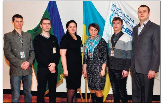
Победители конкурса научных докладов

Львиную долю в организации таких конкурсов на Южно-Украинской АЭС, совместно с администрацией и специалистами кадровой службы предприятия, берет на себя и организация молодежи Южноукраинской объединенной организации профсоюзов (ОМ ЮООП). Кроме этого, вот уже много