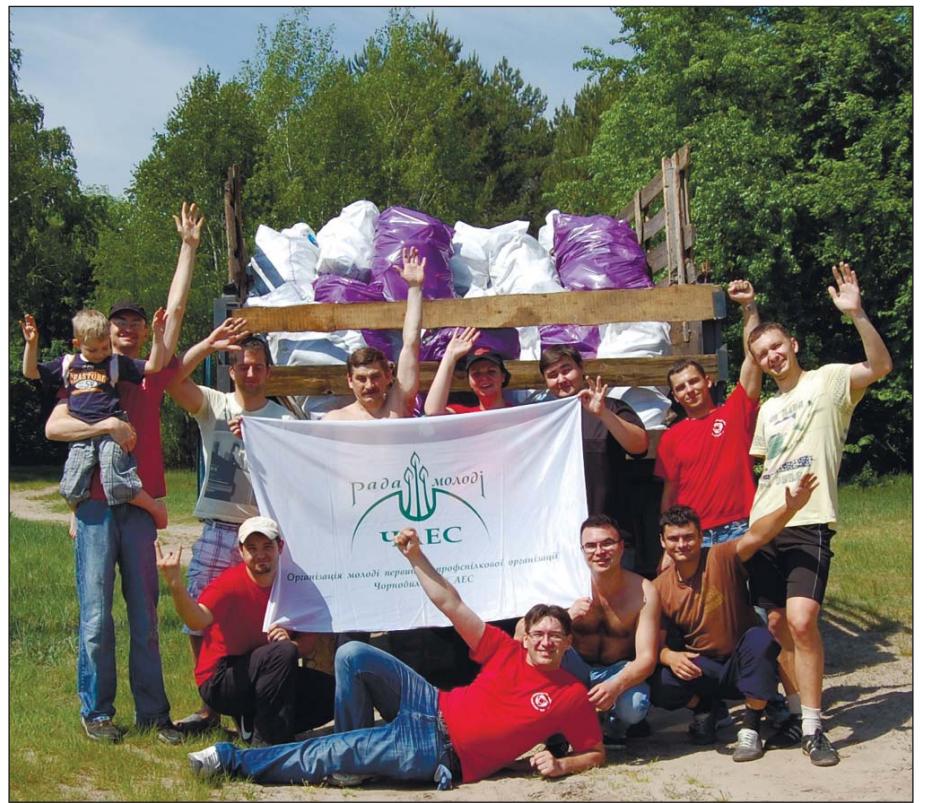
Екологічний суботник організації молоді первинної профспілкової організації Чорнобильської АЕС (Читайте на 4-й стор.)

З повагою Голова Атомпрофспілки України Валерій МАТОВ