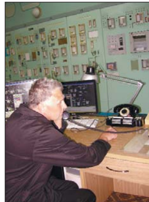
ГП «Смоли»: когда работа в радость