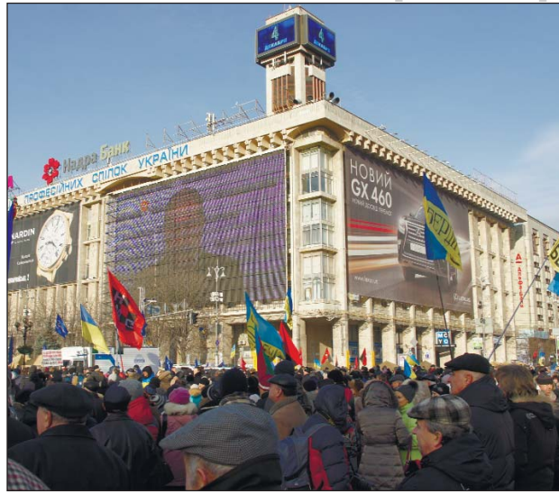
Будинок ФПУ, грудень 2013 року