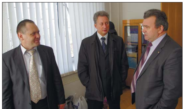
Сотрачники з Чорнобильської АЕС у новому офісі Атомпрофспілки