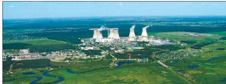
РАЕС з висоти пташиного польоту.