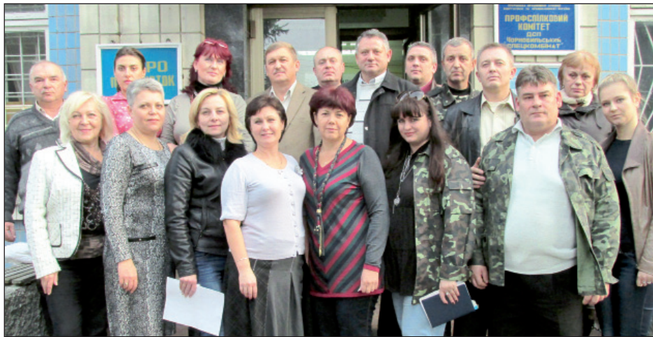
Чорнобильська об'єднана організація Атомпрофспілки

Але жителі м. Славутич не квапилися переходити (влаштуватися) на роботу на підприємства зони відчуження, їх можна було зрозуміти. Змінити висококваліфіковану, високооплачувану роботу на ЧАЕС на низькокваліфіковану і низькооплачувану — на це наважувалися одиниці. Однак ситуація в останні роки почала змінюватися. Додаткових робочих