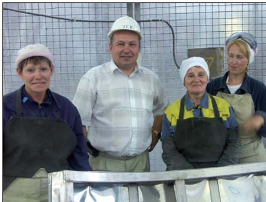
Коллектив заводу спеціальних конструкцій ВП «Атоменергомаш», що перебуває у сфері впливу Енергодарської об'єднаної організації Атомпрофспілки, у 2004 році освоїв випуск нової «атомної» продукції — зйомну теплоізоляцію. Ще рік тому працівники однойменного цеху ЗСК видавали виріб, що називається, «з коліс», а з 2008-го постають зйомну теплоізоляцію задвоє до планового ремонту того чи іншого енергоблока АЕС України.

нопроекту щодо обов'язковості укладення колективних договорів незалежно від форми власності та господарювання, підвищення відповідальності роботодавців за невиконання їхніх умов, у тому числі стосовно соціального захисту найманого працівника; приведення податкового законодавства у відповідність до Закону України «Про професійні спілки, їх права та гарантії діяльності» у частині віднесення на валові витрати коштів, які роботодавці зобов'язані відраховувати на медичне страхування і первинним профспілковим організаціям — на культурно-масову, фізкультурну та оздоровчу роботу; забезпечення бюджетного фінансування заходів, передбачених статтею 44 Закону України «Про професійні спілки, їх права та гарантії діяльності»; розробка проекту закону України щодо оптимізації рівня зарплати із собівартістю продукції з урахуванням світових цін, внесення змін до законів України «Про колективні договори та угоди» і «Про оплату праці» в частині запровадження мінімальних галузевих стандартів оплати праці, застосування норм укладених угод до всіх господарюючих суб'єктів; необхідність підготовки проектів законодавчих актів з питань пов'язаних із вступом держави до СОТ, для першочергового їх розгляду на засіданнях Верховної Ради України. (Закінчення на 2-й стор.)