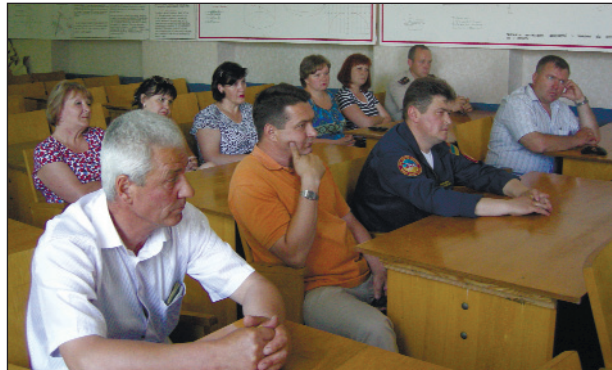
Голова Атомпрофспілки України Валерій МАТОВ під час зустрічі з членами профкому та профспілковим активом САЗу

Валерій Матов зустрівся і з профспілковим активом Спеціального авіаційного загону. Тут також порушувалися наболілі питання тарифної політики держави, підвищення мінімальної заробітної плати та пенсії, податок на пенсії, чого не існує у світовій прак-