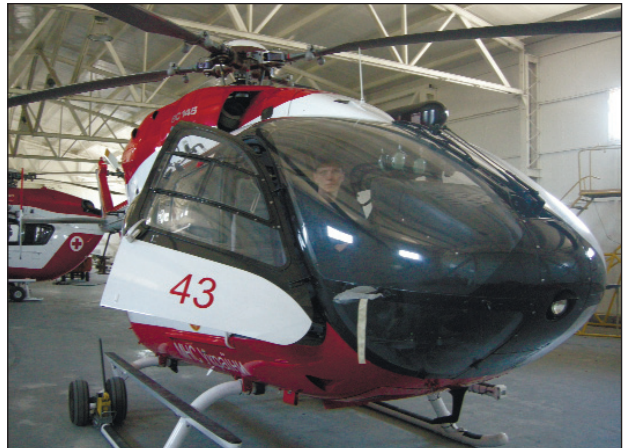
Вертоліт єврокоптер ЕС-145 використовується в основному для моніторингу лісових пожеж

молоді і висококваліфіковані кадри. Коллектив просякнутий військовим духом, пишеться своїми традиціями і порядками тут, як у справжньому армійському підрозділі.