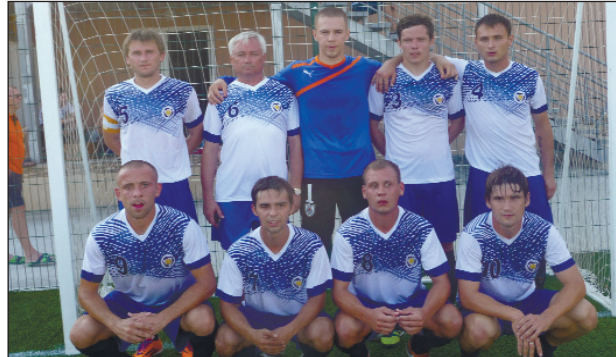
Сборная команда Атомпрофсоюза по мини-футболу — бронзовый призер спартакиады