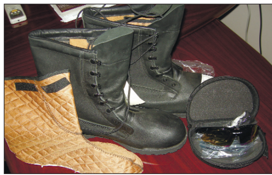
Вторая посылка для Андрея