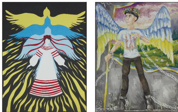
Малюнки переможців конкурсу будуть передані українським політ'язням, решта — виставлено на благодійний аукціон, гроші від якого підуть на підтримку родин українців, які перебувають у російських в'язницях.

На Хмельницькій АЕС підбито підсумки першого етапу конкурсу дитячого малюнка «3 Надією до Перемоги» на підтримку Надії Савченко, Олега Сенцова, Миколи Карпюка та інших політ'язнів, які незаконно утримуються у Російській Федерації. Ідея проведення цього конкурсу запропонована ДП НАЕК «Енергоатом», після налагодження листування з Надією Савченко.