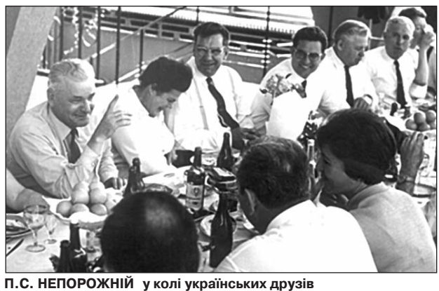
П.С. НЕПОРОЖНІЙ у колі українських друзів

Погруддя П.С. НЕПОРОЖНЬОМУ у Яготині ництвом Петра Непорожнього була успішно здійснена програма будівництва атомних електростанцій в Україні, таких як Рівненська, Запорізька. Швидкими темпами споруджується каскад гідроелектростанцій на Дніпрі. (Закінчення на 7-й стор.)