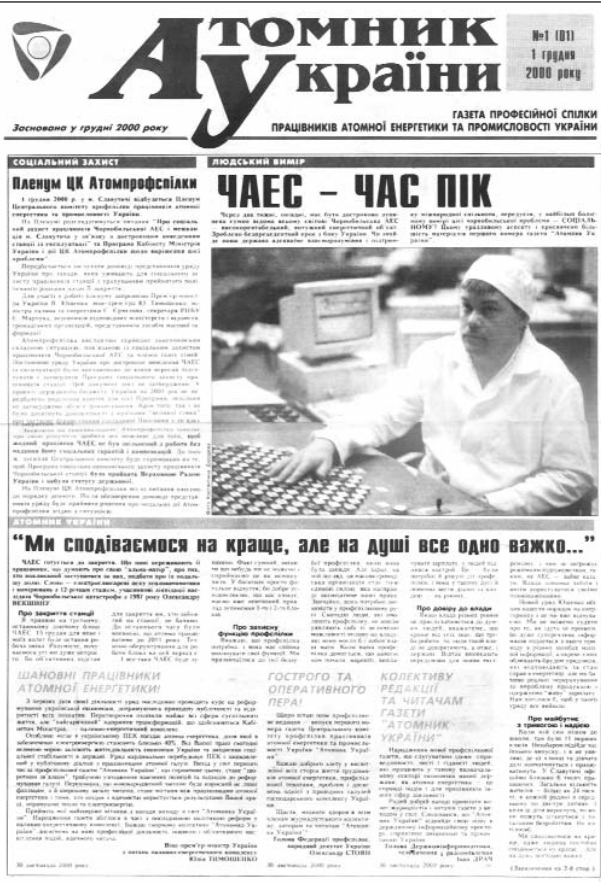
Перший номер «Атомника України»