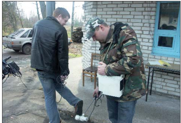
Дозиметрист «Комплекса» за работой