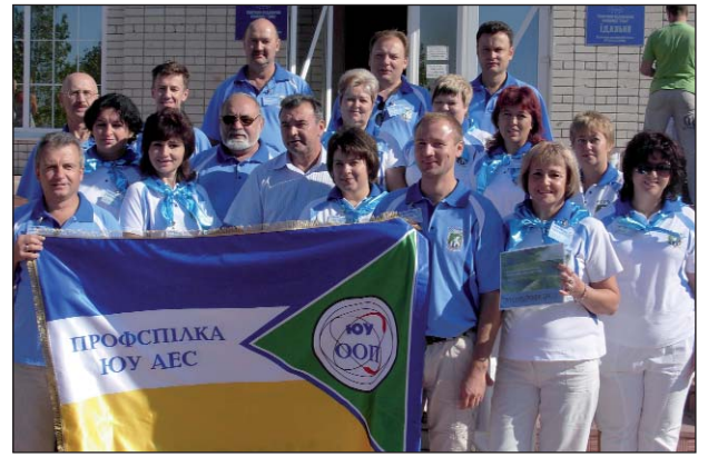
Делегація Южноукраїнської об'єднаної організації профспілки на семінарі в оздоровчому комплексі «Гілея»