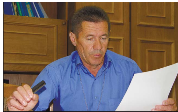
інженер-теплоенергетик, Львівський політехнічний інститут. Нагороди, почесні звання: медаль «За працю і звитягу», знак «Відзнака Атомпрофспілки», почесне звання «Заслужений енергетик України», медаль «За спорудження 4 блока Рівненської АЕС». Загальний стаж роботи: 33 роки.