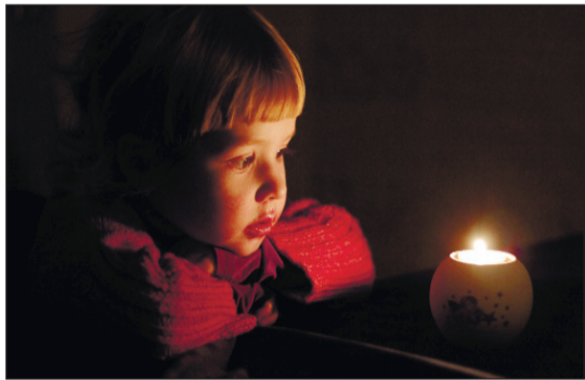
Думи, мої думи...