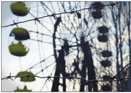
Тот, хто не помнит свого прошлого, обречен на то, чтобы пережить его вновь