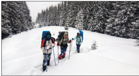
По коліно в снігу. Зимний похід Карпатами