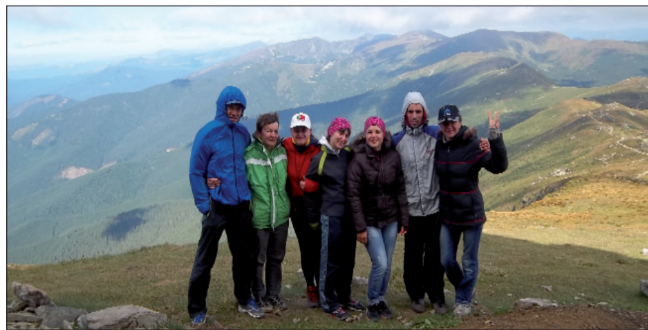
У сонячну погоду Чорногірський хребет з гори Піп Іван — як на долоні