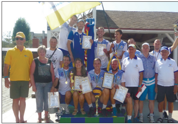
Сборная команда Атомпрофсоюза

Две бронзы, третье командное место, завоеванное