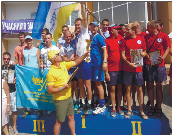
Награждение команды Атомпрофсоюза по волейболу — чемпион на Спартакиады

По поручению отдела по связям с общественностью и СМИ комбината Елена МАЛООК