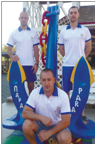
Команда гиревиков, занявшая третье место