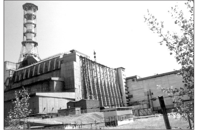
Перший енергоблок ЧАЕС (на знімку — чорний будинок головного корпусу) і на передньому плані — другий блок