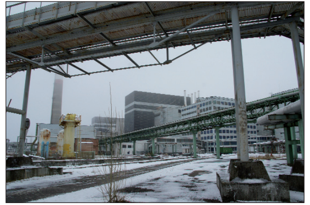
Заступник головного інженера з експлуатації ЧАЕС Володимир ПЕСКОВ: «Зараз усе ядерне паливо із 1, 2 і 3-го блоків станції знаходиться у «мокрому», зберігається у воді в чотирьох відсіках басейну витримки, сховищі №1 (на знімку), що побудоване у 1987 році. Понад 21000 відпрацьованих тепловидільних збірок накопичено тут за період експлуатації ЧАЕС, з 1971-го по 2000 рік, які для надійного і тривалого зберігання будуть поступово, упродовж 10 років, перевезені у СВЯП №2»