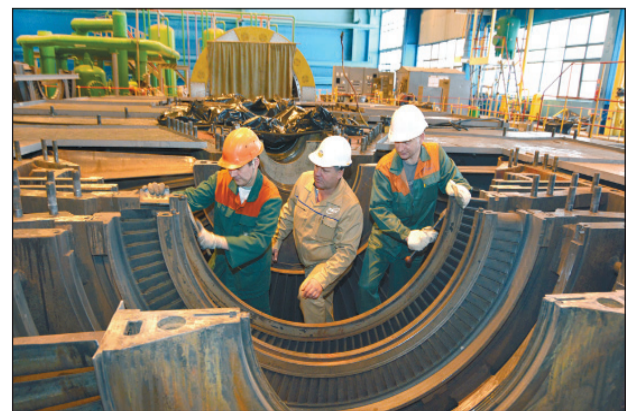
Енергоремонтники Запорізької АЕС