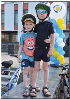
лопробігу вирушають до Білого озера.

І от очікуване «Поїхали!». Єдиною колоною, яка налічує майже 150 учасників ве-