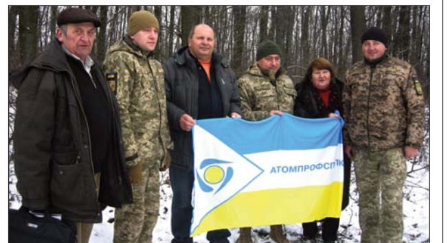
Зустріч волонтерів з представниками військово-цивільної адміністрації Волновахи під час передачі новорічних подарункових наборів бійцям 28-ї окремої моторизованої бригади