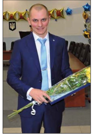
В минувшем году в День энергетика Организация молодежи ЗАЭС была награждена Почетной грамотой НАЭК «Енергоатом»