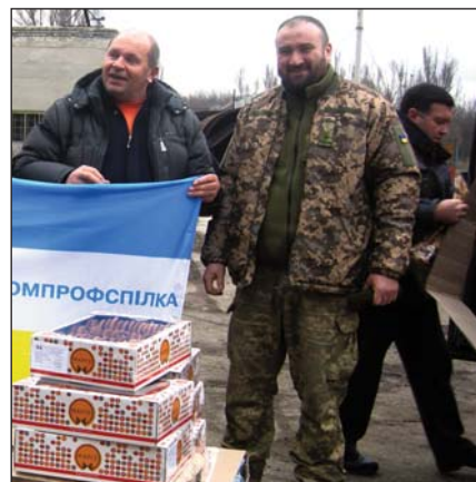
На базі 30-ї Новоград-Волинської окремої моторизованої бригади у Курахому