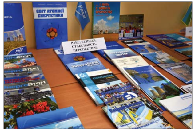
Інформаційний куточок РАЕС