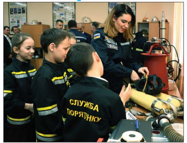
Діти у формі юних рятувальників під час першого відкритого уроку у кабінеті з цивільного захисту та безпеки життєдіяльності

За словами начальника навчально-методичного центру ЦЗ та БЖД Рівненської області полковника служби ЦЗ Сергія Вовчука, організація майбутнього навчання у кабінеті з ЦЗ та БЖД передбачає здобуття вихованцями та учнями загальноосвітніх, професійно-технічних навчальних закладів знань і вмінь з питань особистої безпеки в умовах загрози та виникнення надзвичайної ситуації, користування засобами захисту від її наслідків, вивчення правил