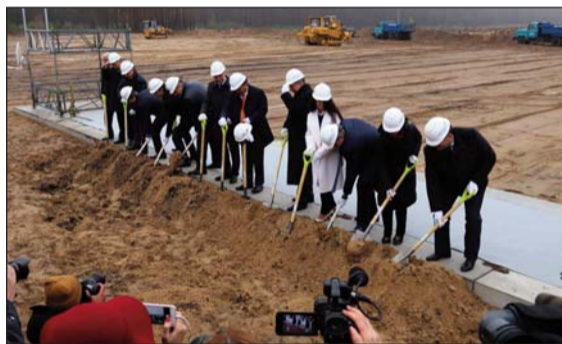
Наприкінці минулого року НАЕК «Енергоатом» та Holtec International офіційно дали старт будівництву одного з найсучасніших і найбезпечніших у світі сховищ для відпрацьованого ядерного палива — ЦСВЯП.