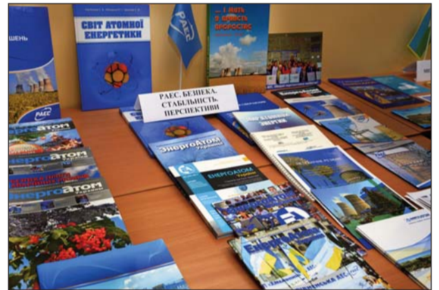
Інформаційний куточок РАЕС