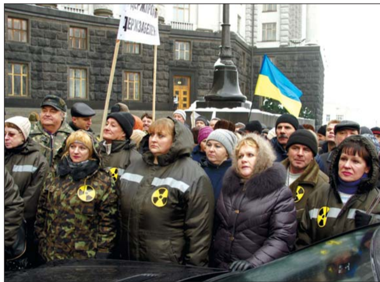
Прекрасні, співчутливі, чарівні і... борці за соціальну справедливість (жіноча солідарність під час акції протесту Чорнобильської ООП у Києві)