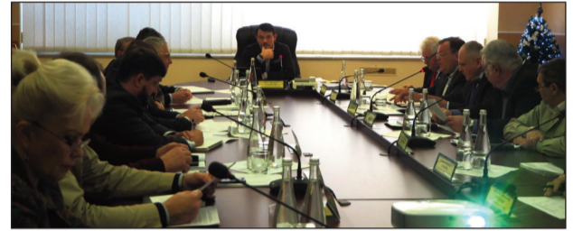
результати робочої поїздки «Енергоатом» Павло Павлишин, т.в.о. президента НАЕК