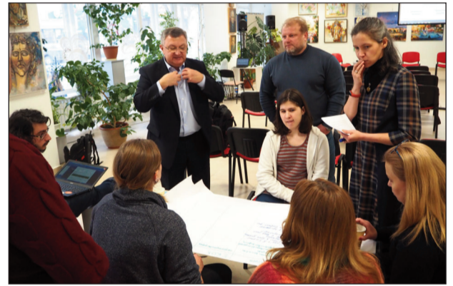
будівництва нових енергоблоків і взагалі припинення діяльності ХАЕС.

У ході обговорюваних ситуацій спеціалісти-атомники наголосили на тому, що коли найближчим часом не почати зводити нові енергоблоки, невдовзі не буде чим замінити діючі енергоблоки. Це дуже серйозне питання, над яким працювали науковці, галузеві професіонали, проєктанти, економісти, державники і виклали єдину позицію в Енергетичній стратегії України — потрібно розвивати атомну енергетику в країні, адже у нас чималі запаси природного урану, є досвід, гарні фахівці, природні можливості. І найголовніше — потрібно займати позицію доброго господаря, адже вже стільки зроблено в цьому напрямі. Одні лише зведені будівельні конструкції стосовно загального кошторису проєкту становлять 30 відсотків вартості.