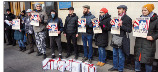
Маніфестація профспілок України біля стін «соціального» комітету Верховної Ради України, 15.01.2020 року