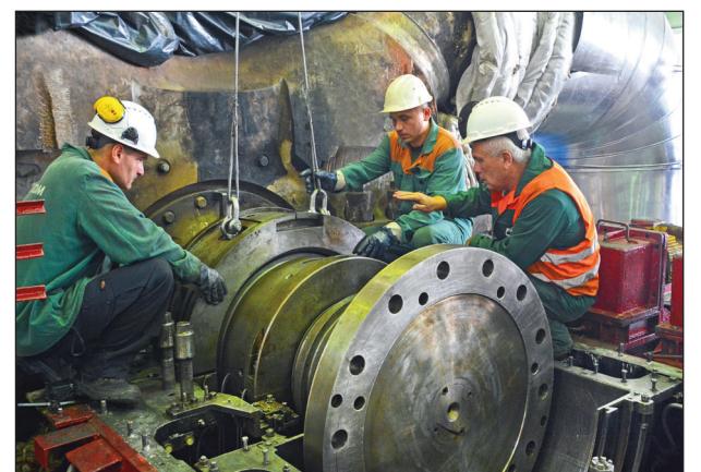
Під час одного із середніх планово-переджувальних ремонтів на енергоблоці №3 Рівненської АЕС

У сфері впливу Атомпрофспілки перебувають підприємства Міненерго України, Мінприроди, Мінохорони здоров'я України тощо