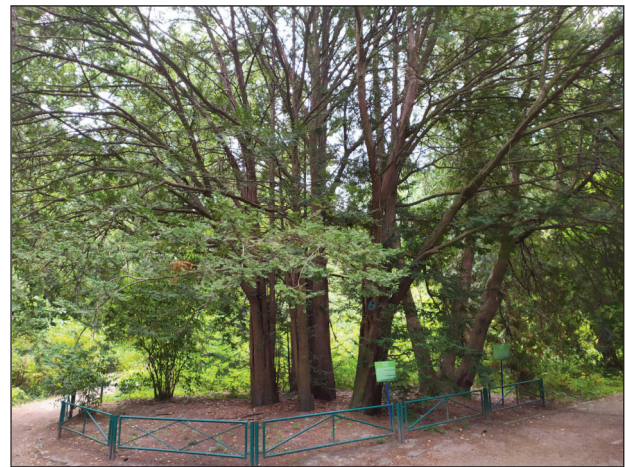
У нижній частині Сирецького дендропарку зосереджено до сорока вікових дерев, найстарішому з них — 145 років! Тися Далекосхідну було висаджено ще 1875 року