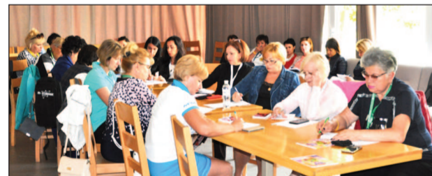
Під час Форуму було проведено навчання профспілкового активу та головних бухгалтерів (скарбників) ППО та ООП