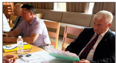
Як завжди, по-діловому і конструктивно, пройшло засідання Президії ЦК Атомпрофспілки. Присутні розглянули низку важливих питань