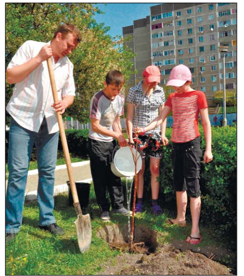
тями у воспитанников центра и их воспитателей.

Руками работников ЦВКВ и воспитанников Южноукраинского центра социально-психологической реабилитации детей, лишенных родительской опеки, было сделано немало: высажено 10 плодовых деревьев и 6 кустов, покрашен забор, установлены урны, сделаны и установлены лавочки и игровые столики, установлена горка, отремонтированы карусели, подметена территория и посажены цветы. И это только первые шаги. Коллектив ЦВКВ уже строит планы помощи этому детскому учреждению и на будущее, рассчитывая не ждаты следующие субботника, а стать частыми гос-