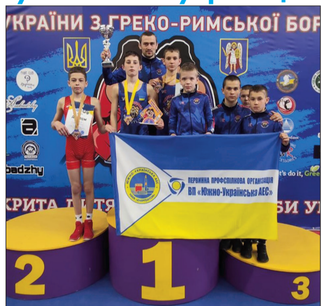
На фото: команда отделения греко-римской борьбы спорткомплекса «Олимп» ОП ЮУАЭС — участники Чемпионата Украины среди юношей 2006–2007 г. р.

В шаге от медали оказался еще один наш спорт-