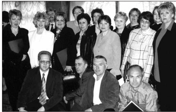
Делегация от ЗАЭС на отчетно-выборной профсоюзной конференции НАЭК «Энергоатом» (г. Киев, 2002 год)